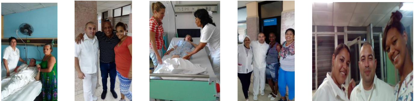
Fig.2 Fotos que evidencian el adecuado desarrollo de las habilidades comunicativas en las relaciones interpersonales enfermero-pacientes-cuidadores y equipo de trabajo desde la Educación Sanitaria.