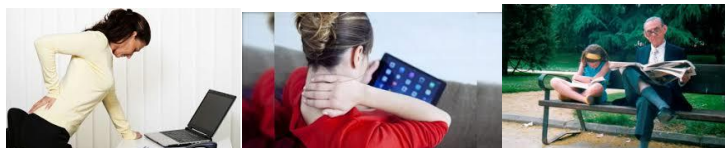
Fig.2 Fotos que evidencian

Modalidad de tratamientos a emplear en el alivio o desaparición del dolor, conocida como Medicina Natural y Tradicional. Actualmente, algunos autores abogan por el uso de la medicina tradicional asiática. Los pueblos de Asia conocen la acupuntura desde la Edad de Piedra y la utilizan como un importante método terapéutico.