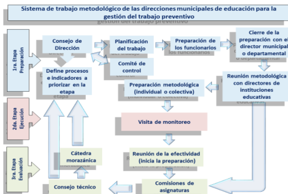
Figura 2. Esquema del sistema de trabajo metodológico de la dirección municipal de educación.

La Figura 2 ilustra el Sistema de Trabajo Metodológico de la Dirección Municipal de Educación, estructurado a partir de la concepción teórico-metodológica que sustenta el presente estudio. Este esquema integra los tres núcleos básicos —diagnóstico, organizativo y estructural— y muestra cómo se articulan para orientar la planificación, ejecución y evaluación de la labor preventiva. La figura permite visualizar de manera clara la relación entre los componentes teóricos y metodológicos del sistema, destacando la interacción entre dirección, docencia y acciones preventivas, así como su impacto en la formación integral de los estudiantes y la articulación con la comunidad escolar."