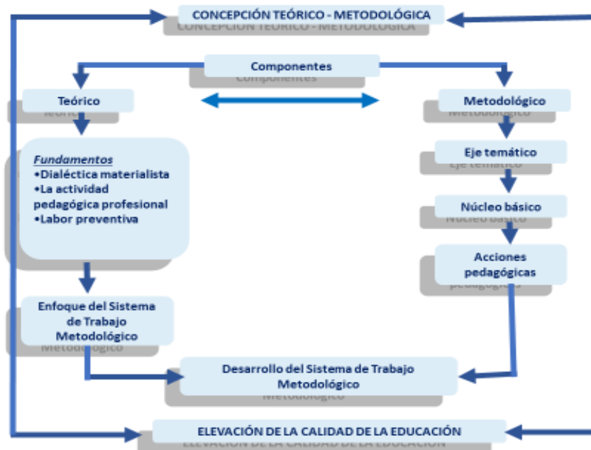
Figura 1. Esquema que muestra la concepción teórico-metodológica. Fuente: (González y Esponda, 2025). El proceso educativo-preventivo en Honduras. Retos y perspectivas.

En este marco, “la formación y desarrollo profesional, concebidos como un proceso holístico basado en el diagnóstico integral, deben abarcar las dimensiones cognoscitiva, afectivo-motivacional, moral, social y de salud, garantizando una preparación equilibrada y sostenible para el desempeño profesional eficiente” (Díaz, Gómez y Chapellí, 2025, p. 81). La Figura 1 ilustra la concepción teórico-metodológica del sistema de trabajo metodológico municipal en Honduras. Este esquema permite visualizar cómo los tres núcleos básicos —diagnóstico, estructural y organizativo— se interrelacionan y articulan los objetivos institucionales con las necesidades formativas de directores y docentes, asegurando la coherencia del trabajo preventivo en los contextos escolar, familiar y comunitario.